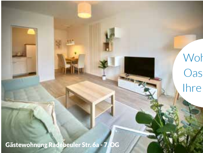
Gästewohnung Radebeuler Str. 6a - 7. OG