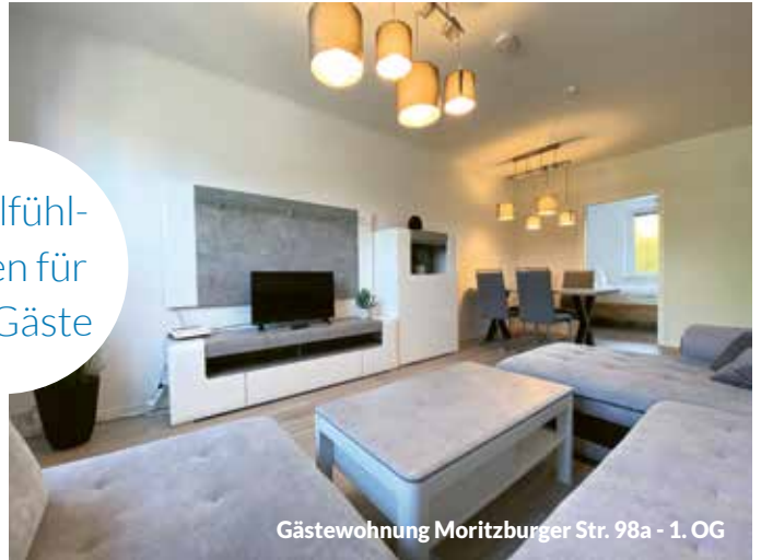
Gästewohnung Moritzburger Str. 98a - 1. OG