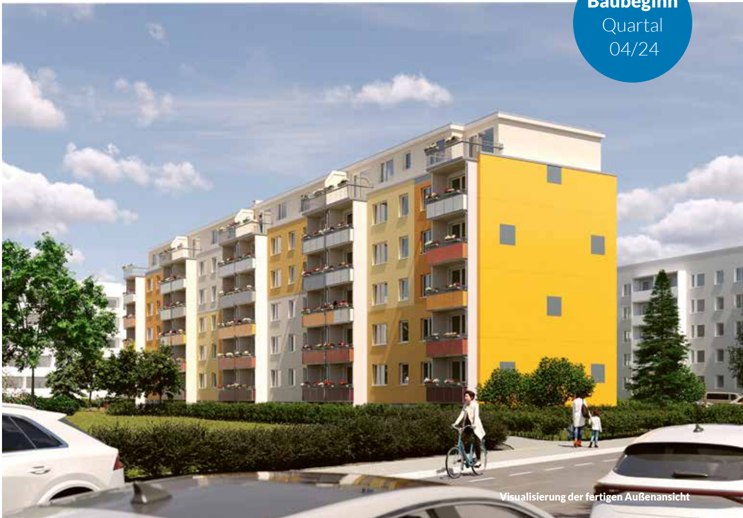
Visualisierung der fertigen Außenansicht