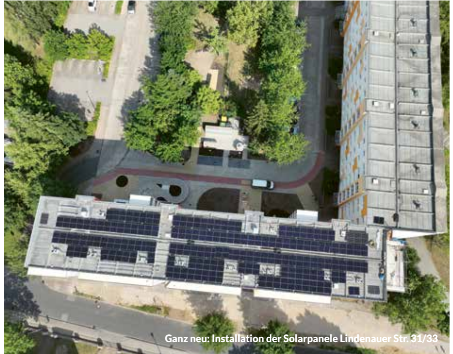
Ganz neu: Installation der Solarpaneele Lindenauer Str. 31/33