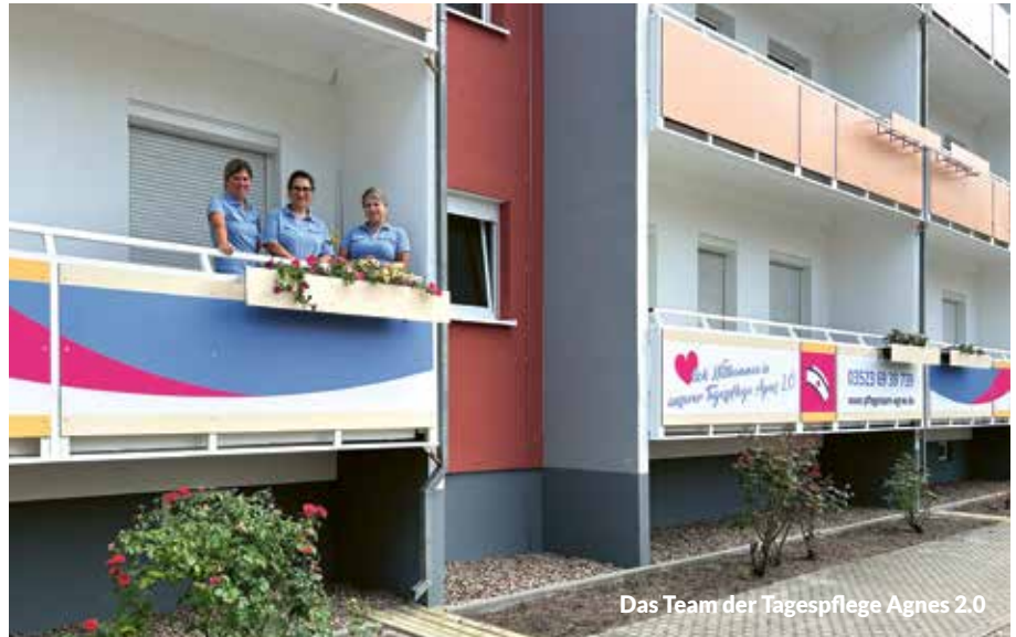
Das Team der Tagespflege Agnes 2.0

In unserer Tagespflegereinrichtung bieten wir eine Vielzahl von Aktivitäten und Leistungen an, die darauf abzielen, Ihren Tag angenehm und bereichernd zu gestalten. Von gemeinsamen Spielen und kreativen Bastelprojekten bis zu entspannenden Spaziergängen – bei uns ist für jeden etwas dabei. Wir legen großen Wert darauf, dass unsere Gäste sich aktiv